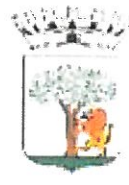
Comune di Noci