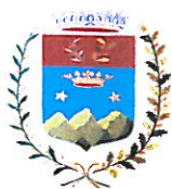
Comune di Putignano